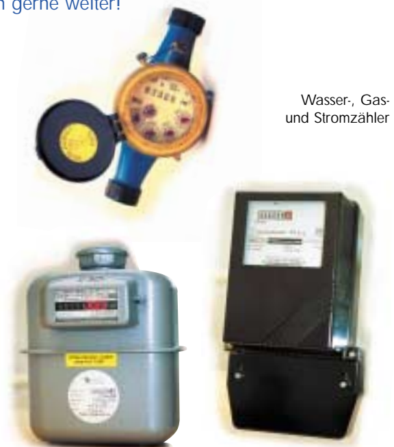
Wasser-, Gas- und Stromzähler